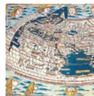
Un mapa sustraído.

Desde que la Biblioteca Nacional hizo público, el pasado 24 de agosto, el robo de dos mapamundis de Cosmografía , una obra de la que se conservan cerca de 120 ejemplares en las más importantes bibliotecas del mundo, se fueron detectando otras sustracciones.