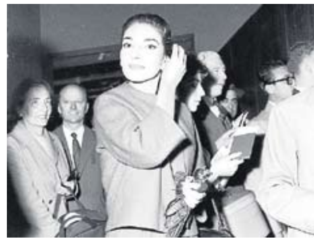
Callas, a su llegada a Londres, en 1954.

Durante su revolucionaria actividad le preocupó cómo romper con ese exceso de protección en los principios pasados. Así, puso énfasis en la pura investigación formal y en la investigación de los efectos del claroscuro, lo que le llevó a idear arquitecturas como esculturas. Como auténticos escenarios. Este cenotafio de Newton es el ejemplo perfecto: hace contrastar esa pequeña sepultura dentro de la inmensa esfera. *